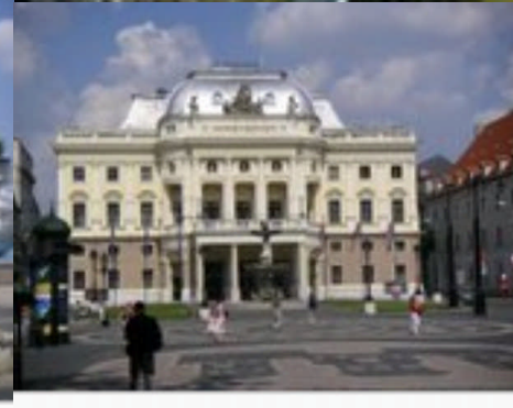
Blick vom Hviezdoslavplatz aufs Nationaltheater