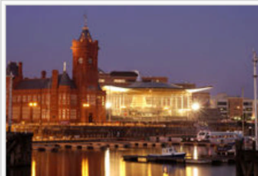
Welsh Assembly buildings in Cardiff Bay: The Pierhead Building (left) and the Senedd.